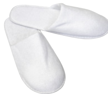
Tornado Terry; 29 cm; closed

5 mm EVA Sohle | Fußform 5 mm EVA sole | footform Semelle EVA 5 mm | forme du pied Suela EVA 5mm | horma del pie HWCS303-100005