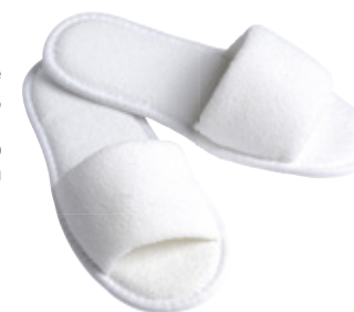
Scirocco Terry; 22 cm; open

5 mm EVA Sohle | Fußform 5 mm EVA sole | footform Semelle EVA 5 mm | forme du pied Suela EVA 5mm | horma del pie HWCS303-100005