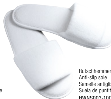
Rutschhemmende Noppensohle Anti-slip sole Semelle antiglisse Suela de puntitos anti-deslizante HWNS003-100005