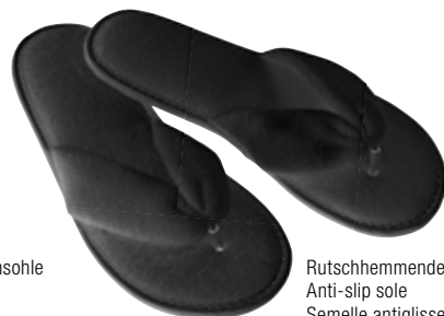
Rutschhemmende Noppensohle Anti-slip sole Semelle antiglisse Suela de puntitos anti-deslizante HWNS008-100005