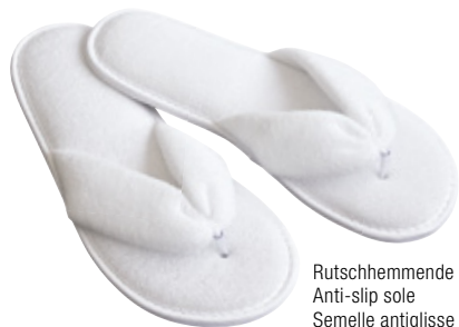
Rutschhemmende Noppensohle Anti-slip sole Semelle antiglisse Suela de puntitos anti-deslizante HWNS007-100005