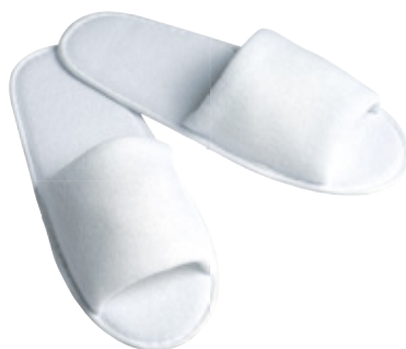
Tornado Terry; 29 cm; open

Non woven Sohle | Einheitsform Non-woven sole | uniform Semelle non-tissée | forme identique Suela de tela no tejida | horma igual HWT0510-100005