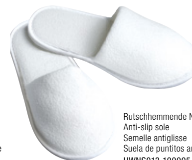
Rutschhemmende Noppensohle Anti-slip sole Semelle antiglisse Suela de puntitos anti-deslizante HWNS013-100005